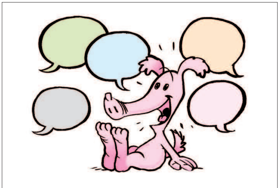
Als Ferkelwelp war Günter besonders aufmerksam. Er hat alles nachgeplappert was er aufgeschnappt.

Unterm Strich hat Günter also lauter praktische Regeln gelernt: Fußgängerampel rot? „Stehen bleiben!“ Ampel grün? „Gehen!“ Doch weil das Leben komplex ist, musste er die Regeln oft weiterentwickeln: Rot mitten auf der Straße? „Trotzdem gehen – und zwar schnell!“ Einem süßen Jungschweinehund imponieren? „Lieber cool sein, statt brav!“ In jungen Jahren ist man schließlich noch flexibel ... Mit der Zeit allerdings haben sich Günters Regeln verfestigt: Essen bei Tisch? „Mit Messer und Gabel!“ Autofahren? „Rechte Straßenseite!“ Sprache? „Deutsch!“ Warum? Weil Günter es früher mal so gelernt und jahrelang nicht verändert hat. „Früher, früher ...“, motzt Günter. »Heute weiß ich selbst Bescheid!« Sicher? Dann pass mal auf: Angenommen, der kleine Hans-Jörg wächst in einem Umfeld heran, in dem alle Sport hassen. Immer wieder hört er: „Sport ist Mord!“ Was hält sein innerer Schweinehund dann wohl vom Schulsport? „Gar nichts!“ Und mit wem versteht sich Hans-Jörg in der Klasse gut? „Mit anderen Nicht-Sportlern!“