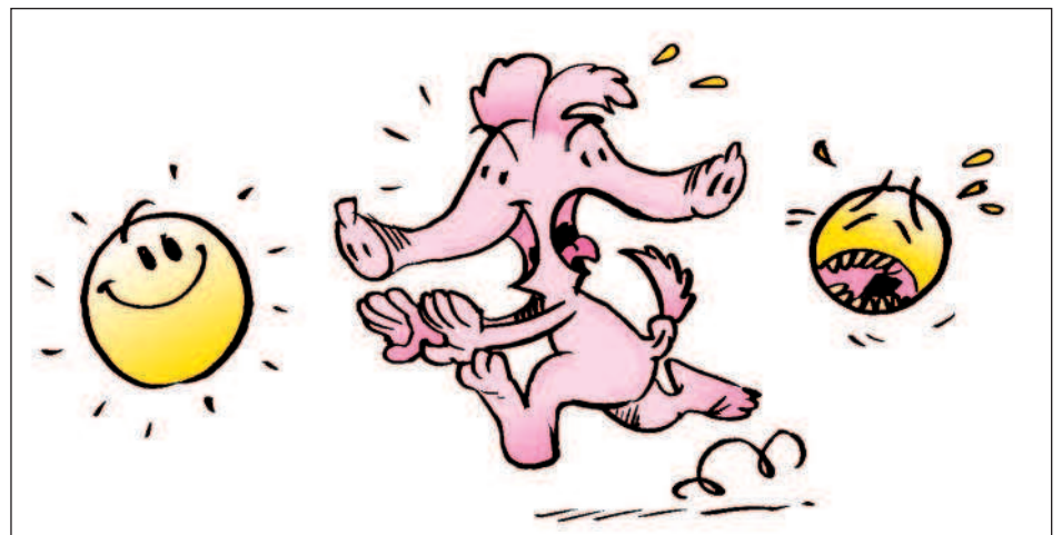
Lust-Schmerz-Prinzip = Lust gewinnen + Schmerz vermeiden

Was ist besser: eine Aufgabe schnell zu erledigen oder sie hinauszuzögern? „Hinauszögern!“, ruft Günter. Klar, denn so will dein Schweinehund Anstrengung, also Schmerz, eine Weile verhindern und dabei möglichst lange das Glück des Faulenzens, also Lust, erleben. Aber man kann es auch andersherum betrachten! Ist es nicht unangenehm, eine lästige Pflicht vor sich zu haben als hinter sich? Sind nicht die meisten Aufgaben weit weniger anstrengend als gedacht, wenn man sie mal angefangen hat? Ist es nicht ein herrliches Gefühl, am Ziel zu sein? „Sicher ...“, grunzt Günter kleinlaut. Die spannende Frage ist also: