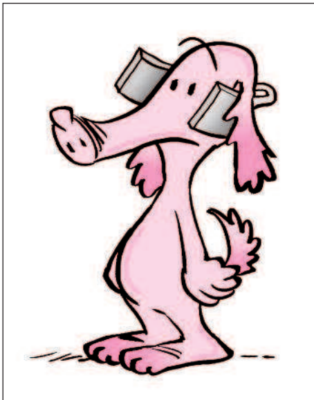
Mit guten Argumenten wird jede Sichtweise richtig.

Was bewertet Günter als Lust, was als Schmerz? Und: Warum eigentlich?