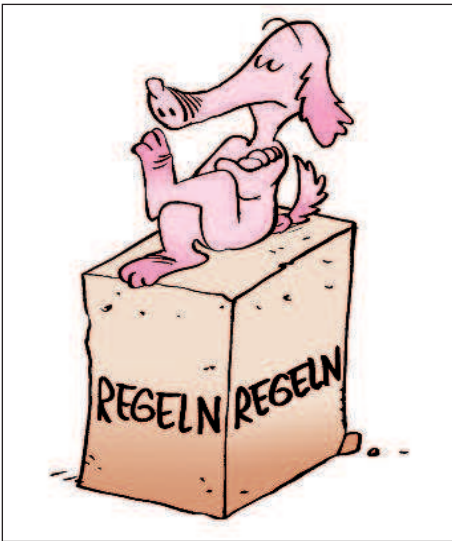
Günter lernt Regeln. Je länger er eine Regel erfährt, desto fester wird sie.

Mord!“ Und kämpft gegen seinen inneren Schweinehund an. Der weiß schließlich Bescheid. Günter glaubt, handelt, lernt, wiederholt, mag und verteidigt – was er mal aufgeschnappt hat.